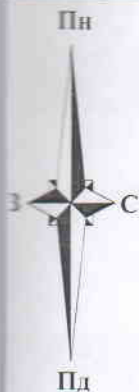
СХЕМА РОЗТАШУВАННЯ ЗЕМЕЛЬНОЇ ДІЛЯНКИ