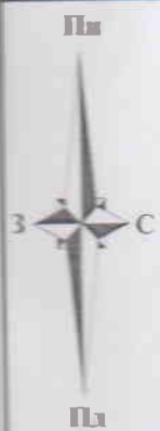
СХЕМА РОЗТАШУВАННЯ ЗЕМЕЛЬНОЇ ДІЛЯНКИ