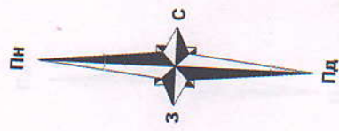
СХЕМА ПЛАНУВАЛЬНИХ ОБМЕЖЕНЬ (ПРОЕКТНИЙ ПЛАН) М 1:500